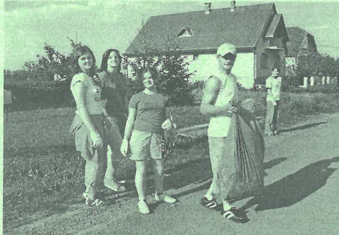
Az egyik jókedvű szemétszedő csapat.

Nem lehet nagyobb öröm a szervezők számára, mint mikor munkájukat siker koronázza. Szeméttelenítési akciónkra közel 80 fő - diákok, tanárok, szülők és a KOBAK aktivistái - vett részt (76 fő, ebből 21 felnőtt). Május 12-én 16 órakor a klub elől csoportokra osztódva bejártuk a Petőfi, a Hegyaljai, az István király, a Szécsényi, a Nagykert, a Kossuth, a Balassi, a Varsányi utat, a Varsányi és Nagykert út között lévő kisutat, az Ady E. utat, a Hunyadi utat, a temető és a templom környékét, a Sportsarnok és a Klub környékét illetve a darázsodótól a rimóci tábláig tartó szakaszt.