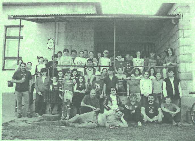
Visszatérve a klub elé.

pontosan 87-en. Hiszen, aki részt vett a munkában, hozhatott magával egy embert. Sajnos, az alsós általános iskolások, koruk miatt, itt nem vehettek részt (10 fő), őket utólag edésséggel jutalmaztuk. A többi fiatal korú részére 11 óráig