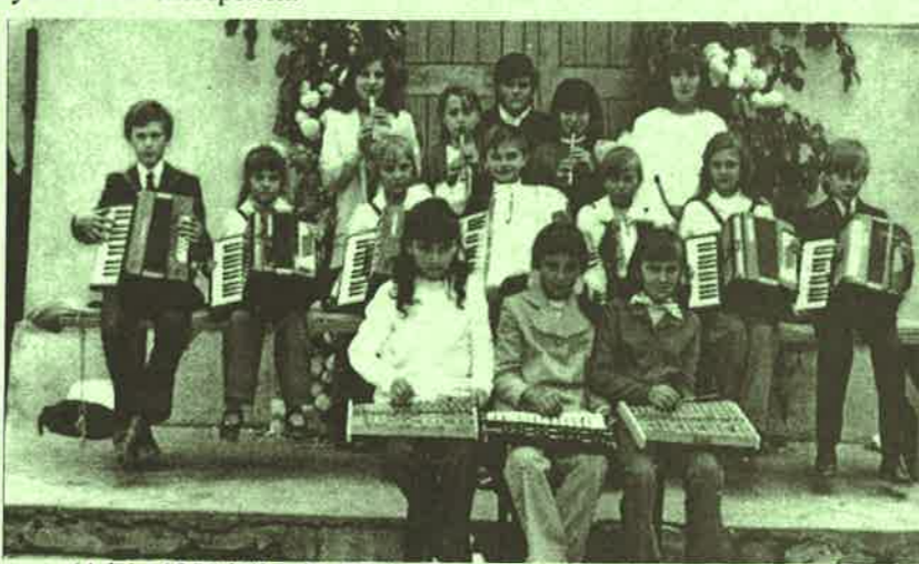
(A kép 1975-ből való)

Mielőtt innen végképp elmegyek, Szeretnék elköszönni emberek! Mint a madár, kit dél vár arra túl, Az eresz alján még egy dalt tanul. (Juhász Gyula)