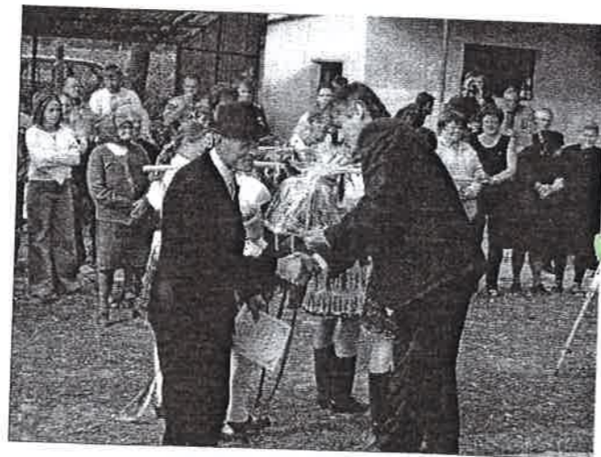
A borverseny díjátadása