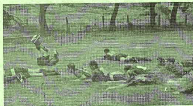
Hason csúzás a vizes pályán