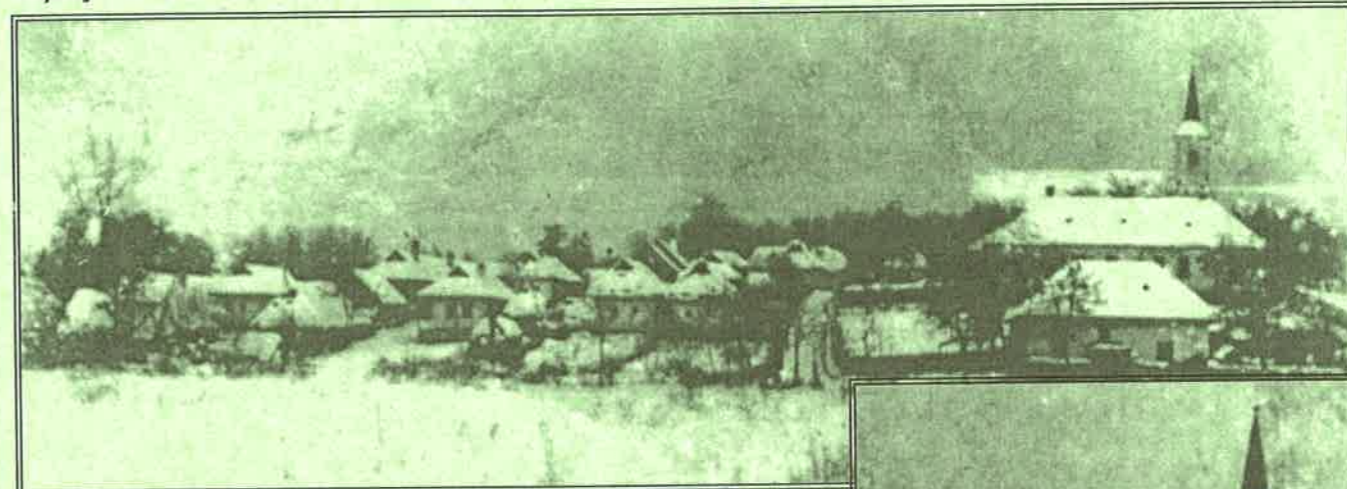
Néprajzi Múzeum, F 9797, Sebestyén Gyula, 1909. (részlet)

Néprajzi Múzeum, F 9798, Sebestyén Gyula, 1909. (részlet)