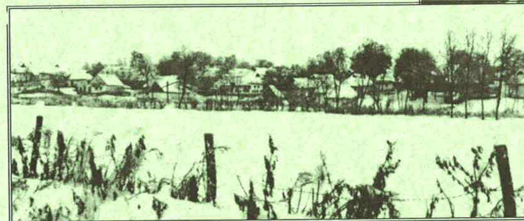
Néprajzi Múzeum, F 9798, Sebestyén Gyula, 1909. (részlet)

Sebestyén Gyula (1864-1946, folklorista, irodalomtörténész) képe a legrégebbi templomábrázolás is többek között. Ez a kép az egyetlen, amely a templomot a kereszthajók nélkül, az 1912-es bővítés előtt ábrázolja. (Sajnos csak oldalról, félig takarásból) Azt is mutatja, hogy a templom hossza már akkor ugyanolyan hosszú volt, mint napjainkban, csak a két kereszthajót illesztették hozzá 1912-ben.