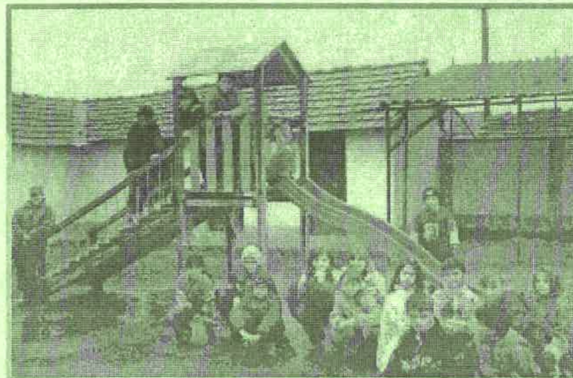
A Hunyadi úti Általános Iskola tanulói boldogan vették birtokba az új csúszdát.

A körzeti védőnő értesíti azokat a férfiakat, akik a szájüreg (gége, garat) szűrésre jelentkeztek, vagy akik még részt szeretnének venni, hogy 2003. december 13-án 1/2 9 – 12.00 óráig jelentkezzenek a Tanácsadó helyiségében. A SZŰRÉS INGYENES!