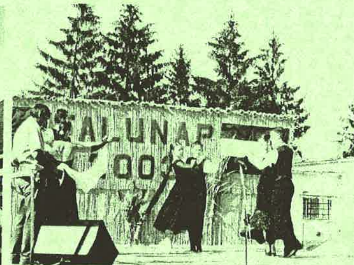
Swng budapesti táncklub salgótarjáni csoport