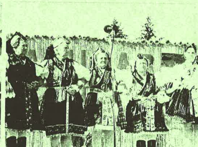
Gyöngyösbokréta Hagymányörző együttes