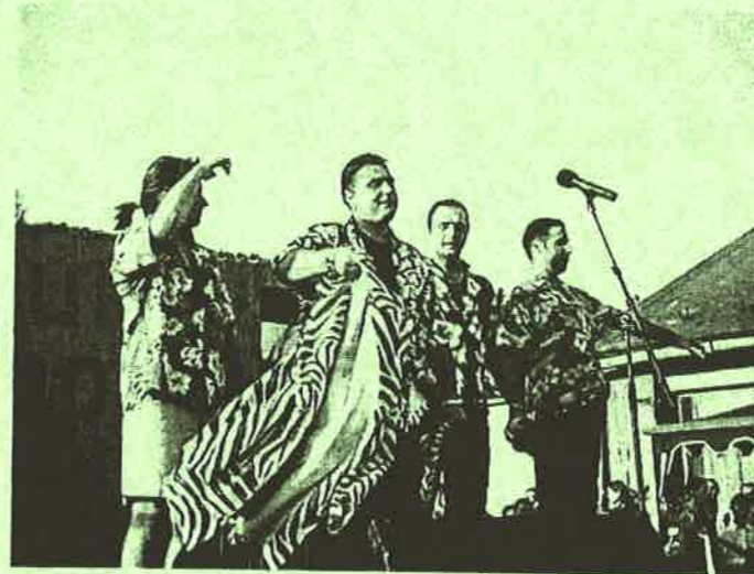
Irigyhónaljmirigy volt a sztárvendég