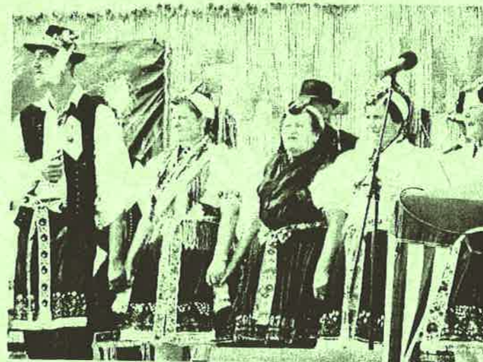
Rimóc Hagymányörző együttes