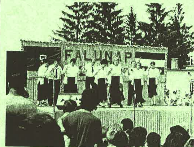
A rimóci általános iskola pedagógusainak görög tánca