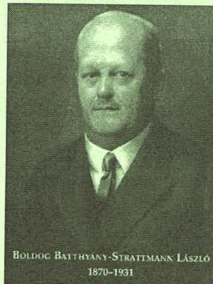
BOLDOG BATTHYÁNY-STRATTMANN LÁSZLÓ 1870-1931

Államférfiakat, nádorokat, hadvezéreket, püspököket, miniszterelnököket adott az országnak az az ezeréves arisztokrata család, amelynek sarja volt. Dr. Batthyány-Strattmann László herceg tudását, vagyonát a szegények szolgálatára áldozta. Példamutató életével, önzetlen cselekedeteivel kiérdemelte, hogy II. János Pál pápa március 23-án, nagyböjt harmadik vasárnapján a boldogok sorába emelte.