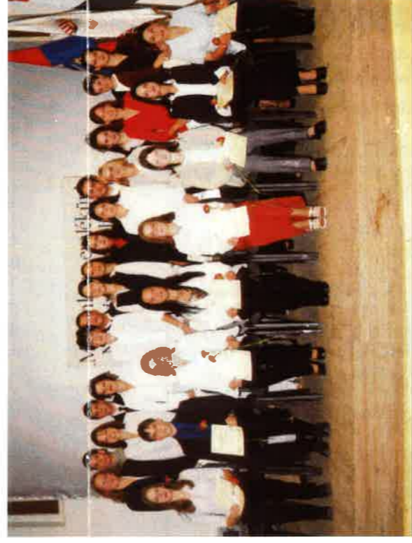
A község díjazott jótanuló