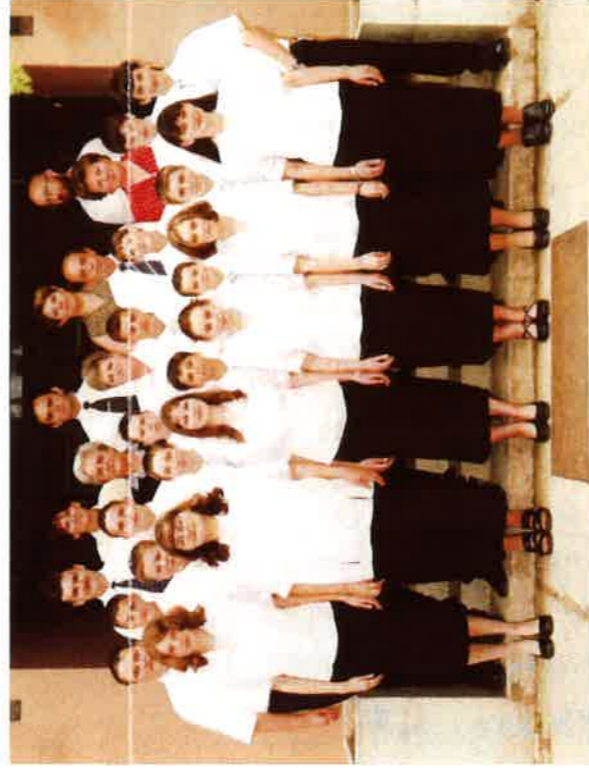
Az Általános Iskola ballagó diákjai 2002.