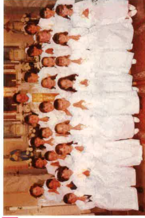
Elsőáldozó gyerekek 2002.