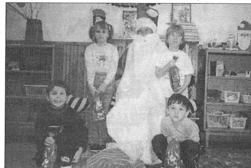
Az óvodásoknál járt a mikulás