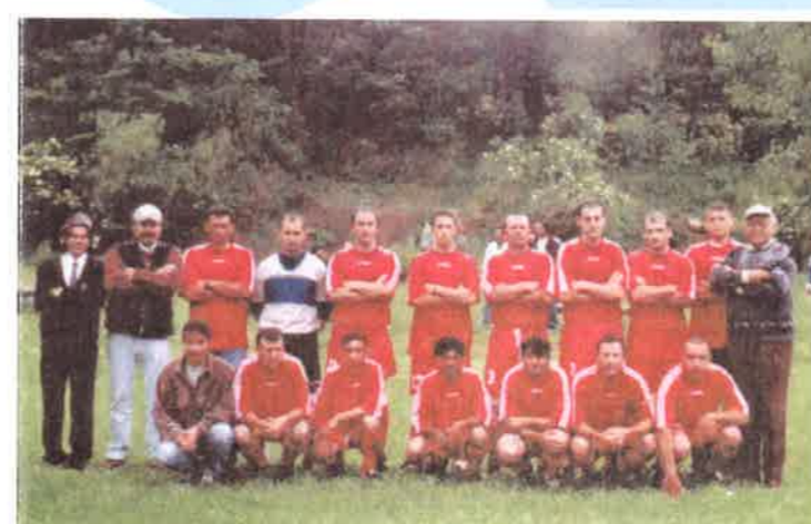
A 2000/2001. évi bajnokságot nyert labdarúgócsapat