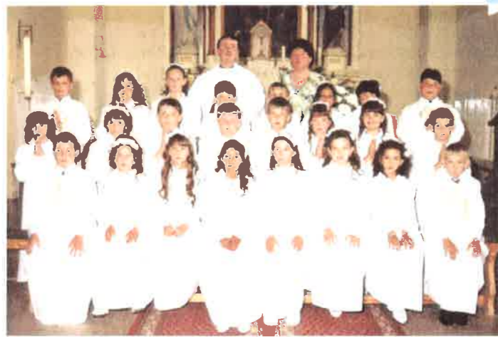
Elsőáldozó gyerekek 2001.