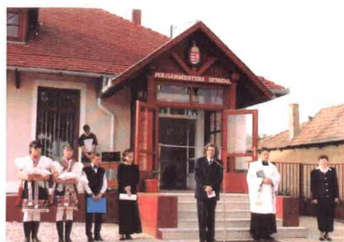
Az új Polgármesteri Hivatal átadása 2001. szeptember 23.