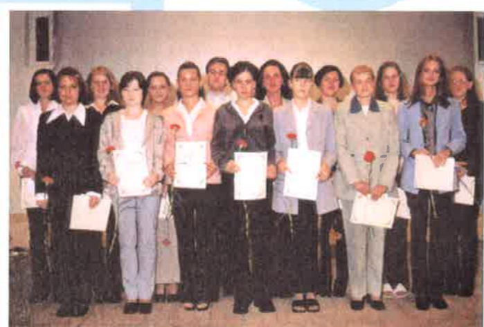
A község díjazott jótanulói