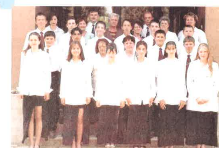
Az Általános Iskola ballagó diákjai 2001.