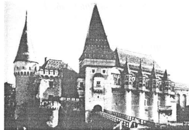
Vajdahunyad vára, a Hunyadiak családi fészke

A török flotta, hogy a várat teljesen elszigetelje a külső segítségtől, valamint hogy az élelmiszerellátást megakadályozza,