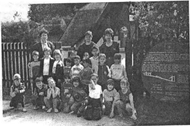
Ipolytarnóci felvétel a ballagó óvodásokkal