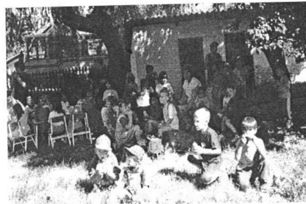
A béri óvodában ebéd közben