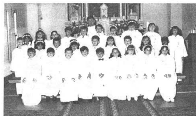
Az idei elsőáldozók