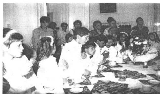
Az ünnepi tízórai