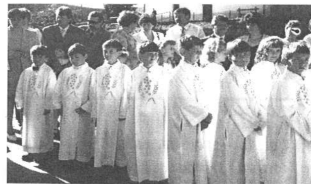
A szülői áldásra várva