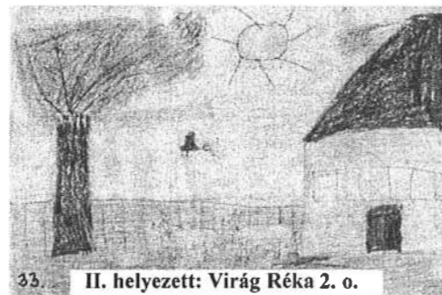
II. helyezett: Virág Réka 2. o.