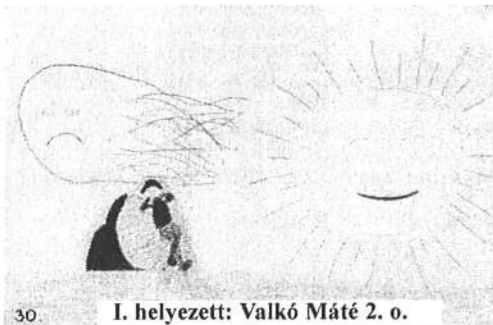
I. helyezett: Valkó Máté 2. o.