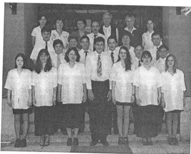
1999 - ballagó 8. osztályosok

Az általános iskolások tanévzáró ünnepélyén június 19-én a hagyományoknak megfelelően elballagtak a 8. osztályos tanulók mind a 12-en meg 2 tanuló az eltérő tantervű osztályból.