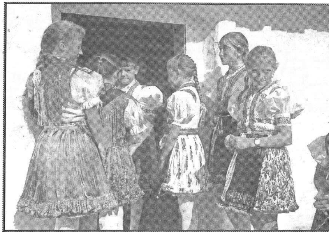
A kép az 1970-es évekből való