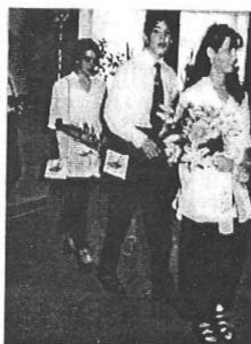
„Ballag már a vén diák” - énekeltek a diákok.