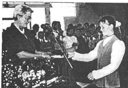
A legjobb tanulók könyvjutalmat kaptak