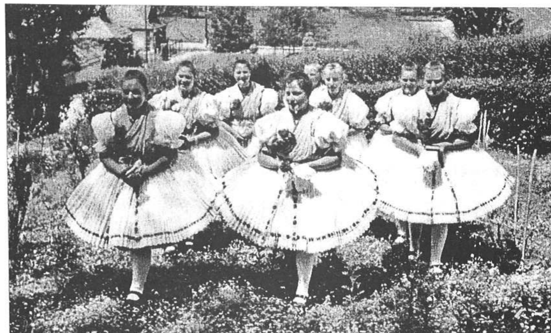
A kép a 65-ös évekből való