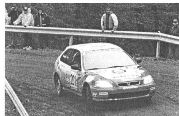
Salgó Rallye-n - útban a cél felé