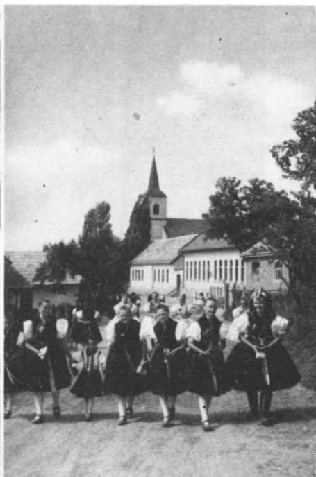
A kép a 60-as évekből való