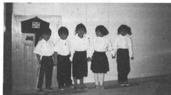
A cigány óvodások is műsorral készültek