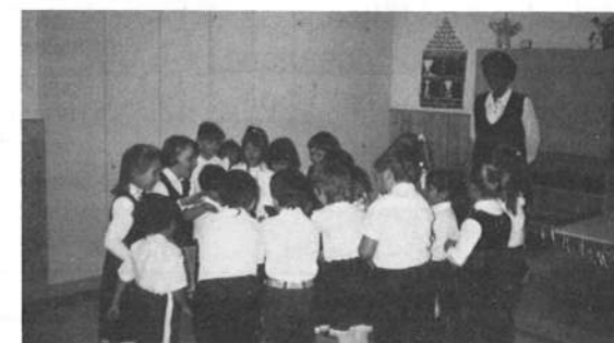
Óvodások egy csoportja előadás közben