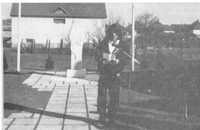
Rimóc község Polgármestere ünnepi beszédet mondott

Az 1848-49-es forradalom és szabadságharc 150. évfordulója