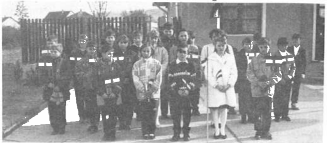
A 4. o. az ünnepi műsort adja elő