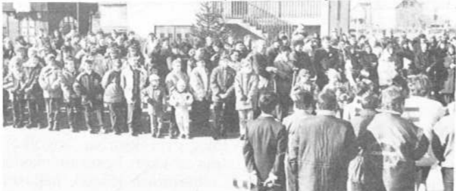
A szoboravatás sok embert vonzott