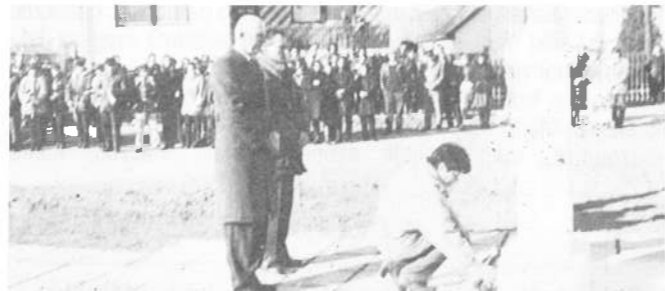
Petőfi Sándor szobrának megkoszorúzása