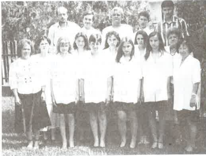
1997-ben végzett általános iskolások