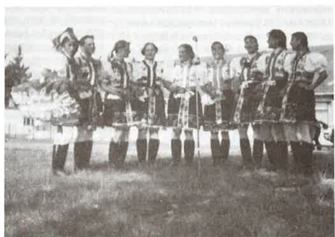
A szüreti „Szőlőslányok”