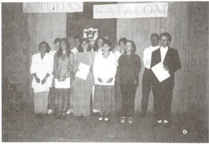
1997-ben jutalmazott tanulóink