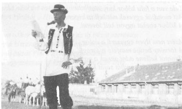
A kisbíró szüreti rimeket olvas