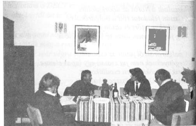
A borbírák munka közben