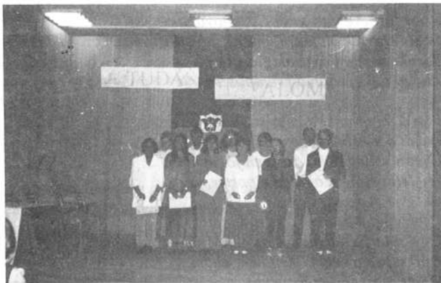
A díjazott jó tanulók