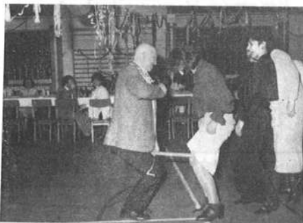
Akló közben az újság szerkesztője