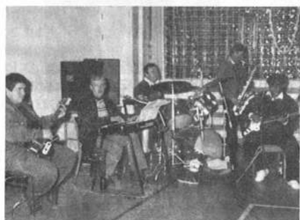
A Rimóci zenekar húzta a talpalávalót