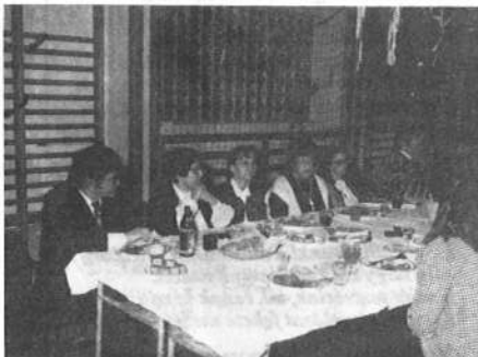
A vaddisznót a vadászok lőtték terítékre az alkalomra