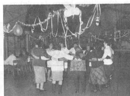
A hangulat varázslatos volt