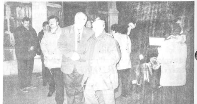
Elköszönt az országgyűlési képviselő és jókívánásait küldte a Rimóci Újság olvasóinak