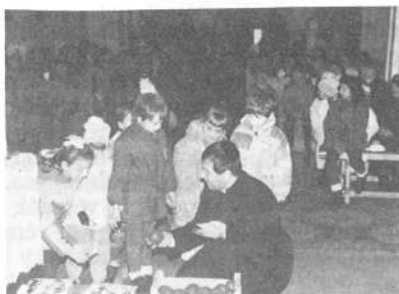
Az újonnan alakult színiárszökörr előadását láthatták a gyerekek templomunkban. Utánna ajándékosztásra került sor melynek minden gyerek örült.